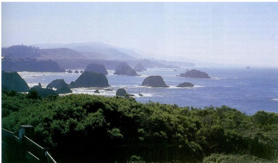
Felsiger Küstenstrich bei Mendocino